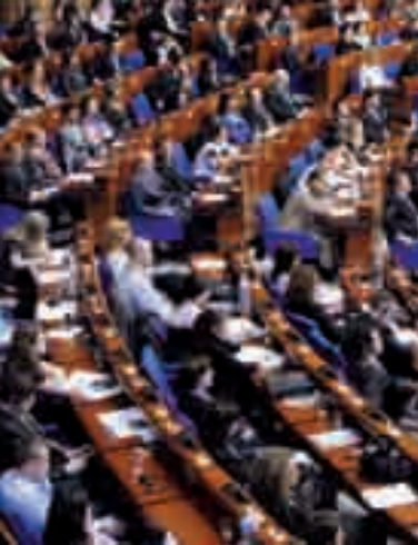
Sejna dvorana, Palača Evrope