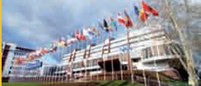
Palača Evrope, Strasbourg