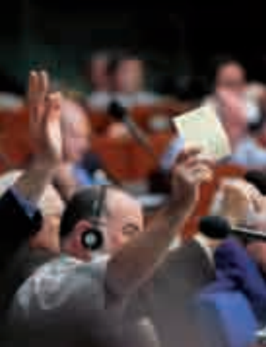
Zasedanje Kongresa lokalnih in regionalnih oblasti