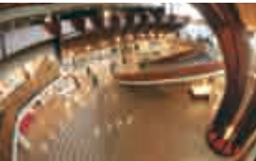
Preddverje Palače Evrope