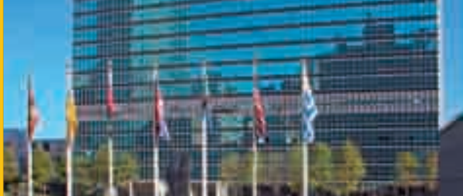
Zgradba Združenih narodov, New York

Uradni odnosi med Svetom Evrope in Združenimi narodi izvirajo iz leta 1951. Oktobra 1989 je Svet Evrope pridobil status opazovalca Generalne skupščine Združenih narodov (ZN). Kot regijski partner Združenih narodov Svet Evrope redno sodeluje pri delu glavnih agencij ZN.