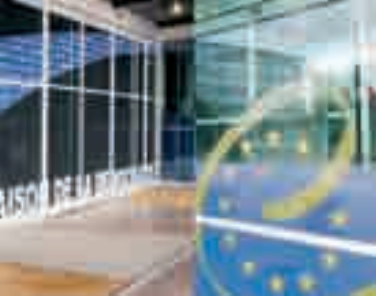
Vhod v Palačo Evrope