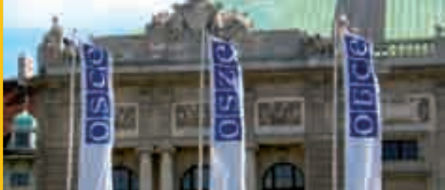
Sedež OVSE, Dunaj

Svet Evrope in Organizacija za varnost in sodelovanje v Evropi (OVSE) vsak na svoj način v Evropi sledita promociji stabilnosti in varnosti na podlagi demokracije, vladavine prava in spoštovanja človekovih pravic.