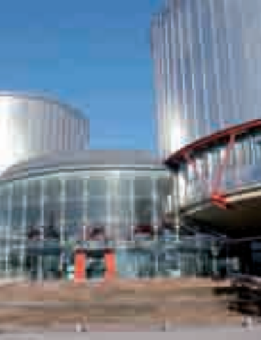
Poslopje Sodišča za človekove pravice