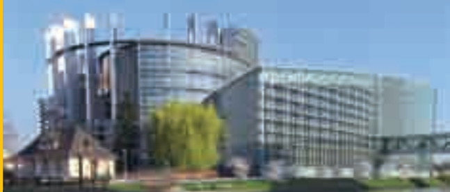
Zgradba Evropskega parlamenta, Strasbourg

Svet Evrope in Evropska unija imata dolgo tradicijo sodelovanja, ki temelji na njihovih skupnih vrednotah: človekovih pravicah, demokraciji in vladavini prava. Obe organizaciji imata koristi druga od druge, vzajemno od moči in primerjalnih prednosti, sposobnosti in strokovnosti vsake organizacije posebej, pri čemer se izogibata nepotrebemu podvajanju.